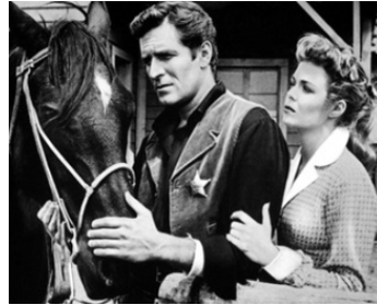
1956 GRAINE DE SHÉRIF (The brass Legend) de Gerd Oswald avec Nancy Gates