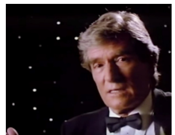
1988 DOIN' TIME ON PLANET EARTH de Charles Matthau