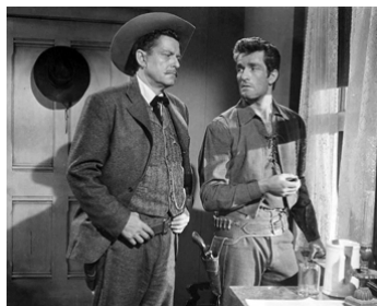
1952 VICTIME DU DESTIN (The lawless Breed) de Raoul Walsh avec John McIntire