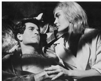
1965 DIX PETITS INDIENS (Ten little Indians) de George Pollock avec Shirley Eaton