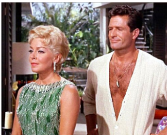
1965 L'AMOUR À PLUSIEURS VISAGES (Love has many faces) d'Alexander Singer avec Lana Turner