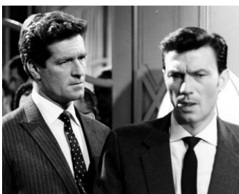
1967 DIAL M FOR MURDER de David Llewelyn Moxey avec Laurence Harvey