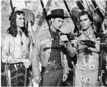
1954 LE DERNIER CHEYENNE (White Feather) de Robert D. Webb avec R. Wagner, J. Hunter