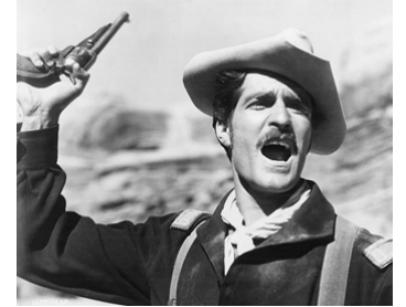
1952 AU MÉPRIS DES LOIS (The Battle at Apache Pass) de George Sherman