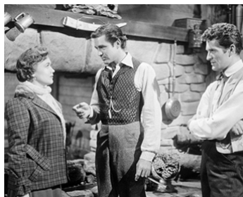
1953 LE JUSTICIER IMPITOYABLE (Back to God's Country) de J. Pevney avec Marcia Henderson, Steve Cochran