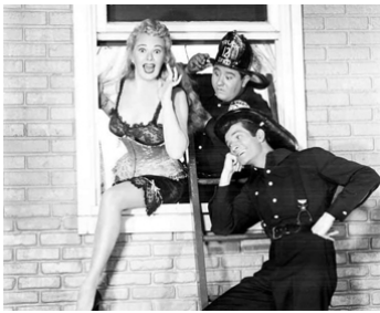
1953 TOUT FOU, TOUT FLAMME (Fireman save my child) de L. Goodwins avec A. Jergens, B. Hackett