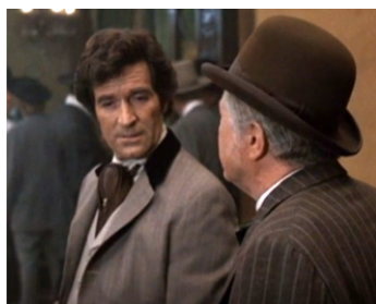
1976 LE DERNIER DES GÉANTS (The Shootist) de Don Siegel avec Harry Morgan