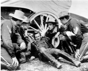
1951 LITTLE BIG HORN (The fighting Seventh) de Ch. Marquis Warren avec L. Bridges, J. Ireland