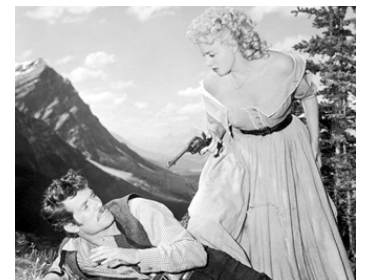
1953 LA BRIGADE HÉROÏQUE (Saskatchewan) de Raoul Walsh avec Shelley Winters