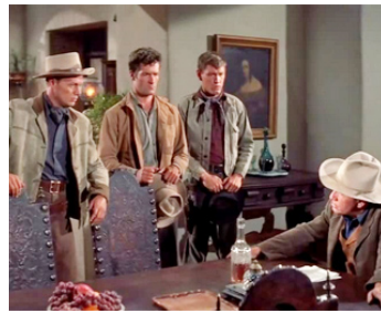
1954 LA LANCE BRISÉE (Broken Lance) d'E. Dmytryk avec R. Widmark, Earl Holliman, Spencer Tracy