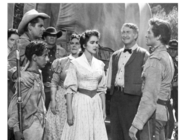
1953 LE DÉSERTEUR DE FORT ALAMO de Budd Boetticher avec Glenn Ford, J. Adams, Chill Wills