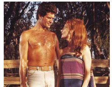
1967 COW-BOYS DE LA BROUSSE (Africa, Texas style) d'Andrew Marton avec Adrienne Corri