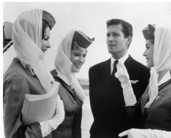
1962 LES FILLES DE L'AIR (Come fly with me) d'H. Levin avec P. Tiffin, L. Nettleton, D. Hart