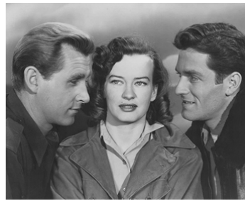
1950 24 H CHEZ LES MARTIENS (Rocketship XM) de Kurt Neumann avec L. Bridges, Osa Massen