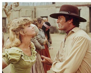
1970 FEMMES SAUVAGES (Wild Women) de Don Taylor avec Anne Francis