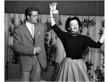
1951 ARDENTE JEUNESSE (On the Loose) de Charles Lederer avec Joan Evans