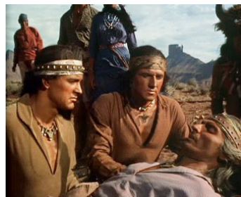
1953 TAZA, FILS DE COCHISE (Taza, son of Cochise) de D. Sirk avec Rock Hudson, Jeff Chandler