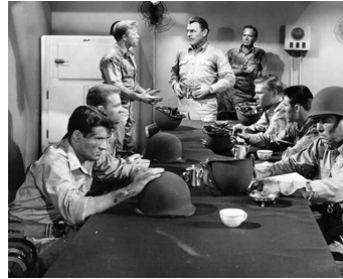
1951 ALERTE AUX GARDE-CÔTES (Fighting Coast Guard) de J. Kane avec R. Jaeckel, Brian Donlevy