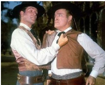
1959 NE TIREZ PAS SUR LE BANDIT (Alias Jesse James) de Norman Z. McLeod avec Bob Hope