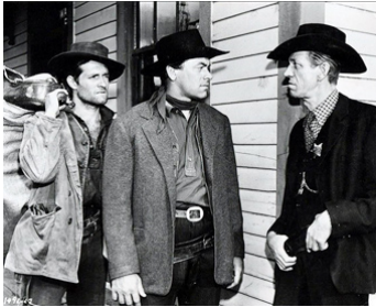
1950 LA VALLÉE DE LA VENGEANCE (Vengeance Valley) de R. Thorpe avec J. Ireland, J. Hayward