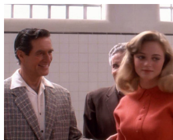
1988 JUMEAUX (Twins) d'Ivan Reitman avec Heather Graham