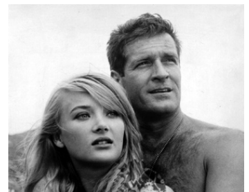
1964 PREMIÈRE VICTOIRE (In Harm's Way) d'Otto Preminger avec Barbara Bouchet