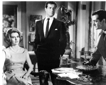
1963 ASSASSINAT À ROME (Il segreto del vestito rosso) de S. Amadio avec Cyd Charisse, A. Closas