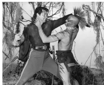
1952 L'EXPÉDITION DE FORT KING (Seminole) de Budd Boetticher avec Rock Hudson