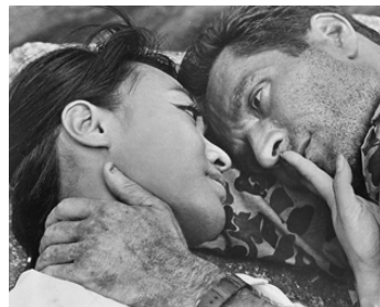
1966 LA BAIE DU GUET-APENS (Ambush Bay) de Ron Winston avec Tisa Chang