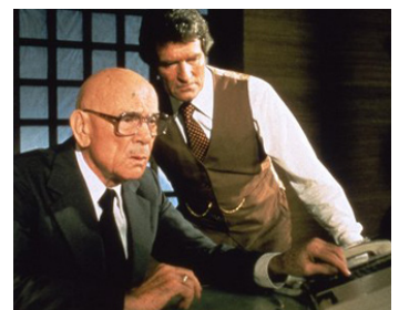
1974 LE JEU DE LA MORT (The Game of Death) de Robert Clouse avec Dean Jagger