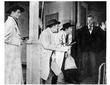
1950 LE RETOUR DE JESSE JAMES (The Return of Jesse James) d'A. Hilton avec J. Ireland, H. Hull