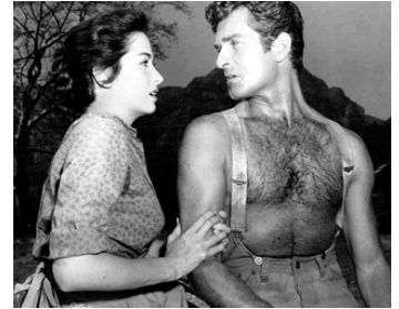
1958 LE TUEUR À LA VOIX DOUCE (The Fiend who walked the west) de G. Douglas avec Linda Cristal