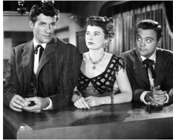
1955 WHISKY, MIRACLES ET REVOLVERS (The Twinkle in God's eye) de G. Blair avec Colleen Gray