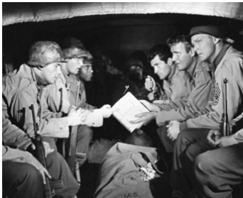
1952 LES CONDUCTEURS DU DIABLE (Red Ball Express) de B. Boetticher avec Alex Nicol