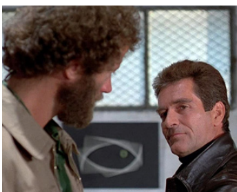
1975 LES MERCENAIRES (Killer Force) de Val Guest avec Peter Fonda