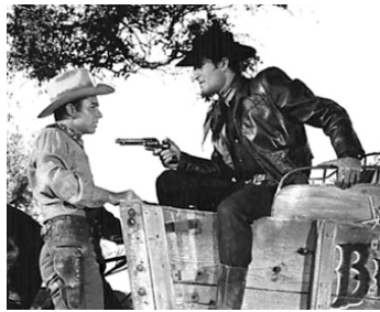
1954 LA RIVIÈRE SANGLANTE (Drums across the River) de Nathan Juran avec Audie Murphy