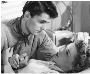
1949 JE VEUX VIVRE (Never Fear) d'Ida Lupino avec Sally Forrest