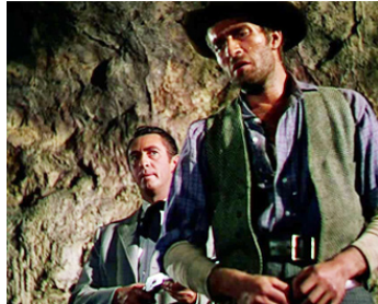
1951 LA CAVERNE DES HORS-LA-LOI (Cave of the Outlaws) de W. Castle avec Macdonald Carey