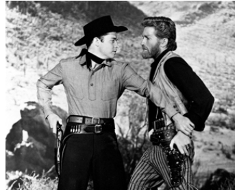
1951 À FEU ET À SANG (The Cimarron Kid) de Budd Boetticher avec Audie Murphy