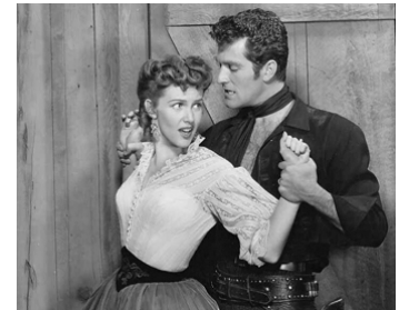
1952 L'HEURE DE LA VENGEANCE (The Raiders) de Lesley Selander avec Barbara Britton