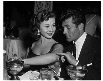
1954 LA JOYEUSE PARADE (There's no business like showbusiness) de W. Lang avec M. Gaynor