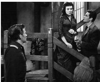
1953 SOULÈVEMENT EN ARIZONA (The Stand for Apache River) de L. Sholem avec Jaclynne Greene